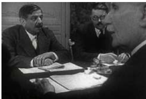
Pierre Laval in Vichy tegenover maarschalk Pétain

Nadat hij zichzelf tot staatshoofd had uitgeroepen, benoemde Pétain op 16 juli een nieuwe regering. Formeel was het staatshoofd ook voorzitter van de ministerraad, maar Laval kreeg